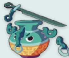
小雷 Drake 總登錄號 IP004-2