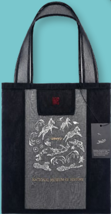
霧透網紗刺繡提袋-常玉動物系列