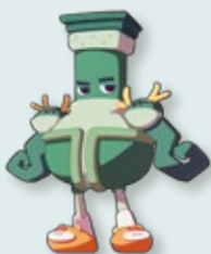
小飛龍 Brenton 總登錄號 IP002-2