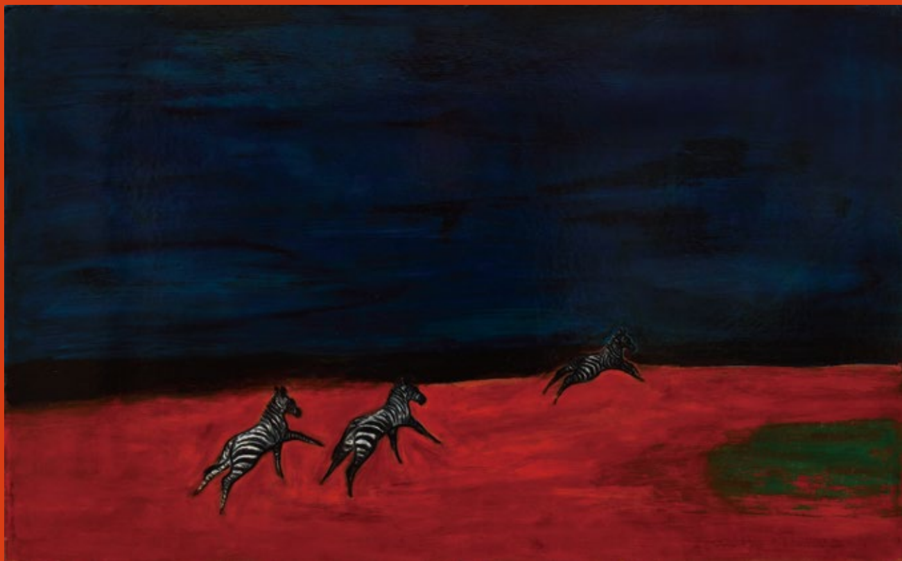
常玉《斑馬》 82×132 cm 館藏編號 26878

國立歷史博物館藏《斑馬》，為常玉（1895-1966）作品之一；此件作品表現斑馬在空曠原野中奔跑，但目的卻渺不可知，以深藍與紅色作為背景，表現出昏暗深邃的天幕與詭譎氣氛的大地。常玉作品中經常表現心境上的孤單，對應於大自然的巨大，動物顯得渺小，反應了當常玉年紀已屆中晚年，對未來充滿了不安與不確定，於是透過風景與動物的題材，表達人類無法對抗大自然及時光的虛度，透露出生命中的無奈與不堪。