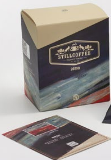
常玉STILL精品咖啡 26898 雙馬 (灰色款) NTD $ 220 / 盒

濾掛式咖啡包 5入 淨重10公克/包 產地 中南美洲 烘焙程度 深焙 處理方式 日曬處理法+水洗處理法 擁有堅果可可優雅風味，順口回甘， 伴隨焦糖奶油香。