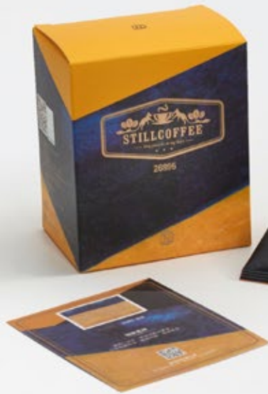
常玉STILL精品咖啡 26895 花豹 (黃色款) NTD $ 220 / 盒

濾掛式咖啡包 5入 淨重10公克/包 產地 中南美洲 烘焙程度 淺焙 處理方式 日曬處理法+蜜處理法 輕爽口感中帶著成熟果香， 口感紮實醇厚楓糖香甜。