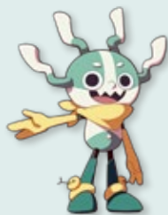
酷獸 Kuper 總登錄號 IP001-2

史博館以館藏文物為原型，創造了「酷獸奇航」原創IP，並透過文創商品、原創主題曲、OP動畫漫畫、Line貼圖及VR沉浸式動畫影片等，期望將歷史文物，轉化為角色IP，讓社會大眾看見更多史博館館藏文物的故事。