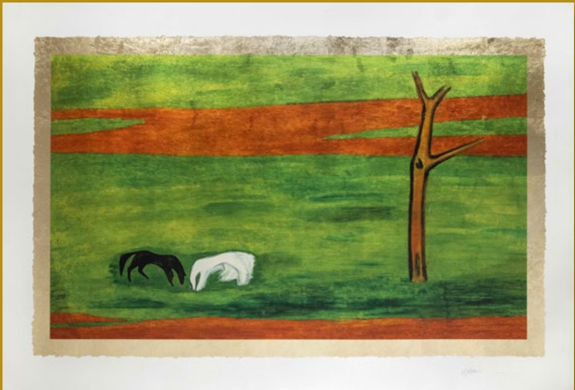
常玉《黑白雙馬》館藏編號 26896 版畫尺寸：92.5×139.7cm 畫芯尺寸：69.5×116.7cm