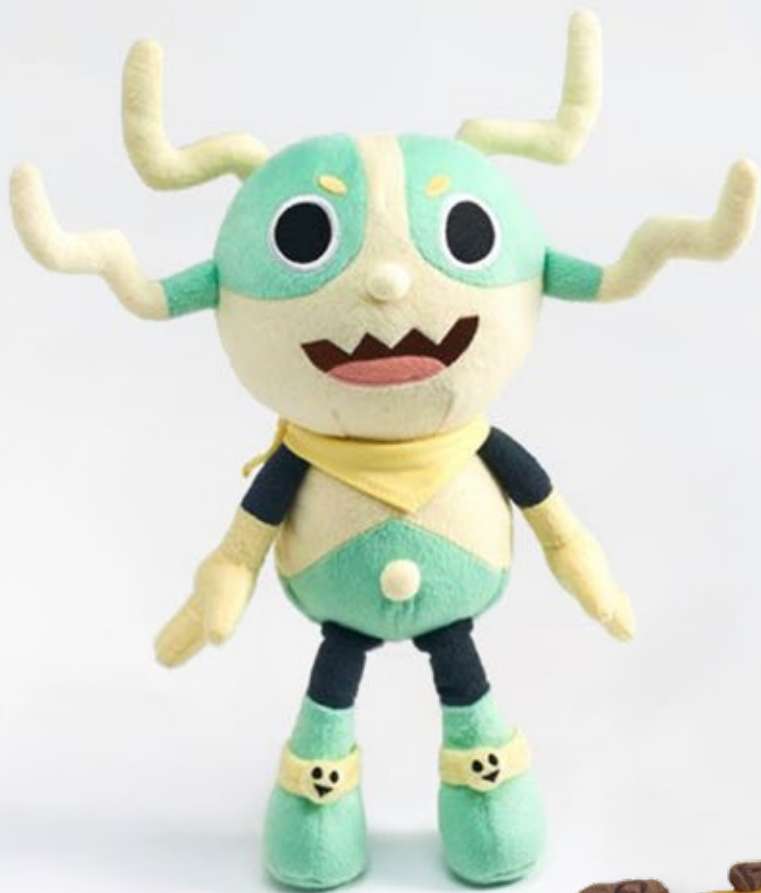
酷獸娃娃 NTD $ 480 聚酯纖維 直立約 30cm