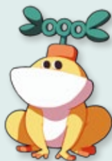
小樹 Otis 總登錄號 IP006-2