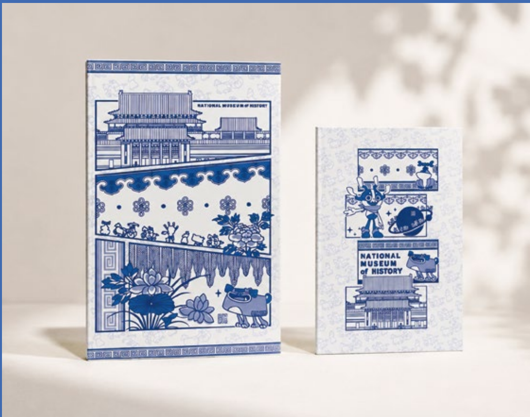
酷獸青花 平裝筆記本