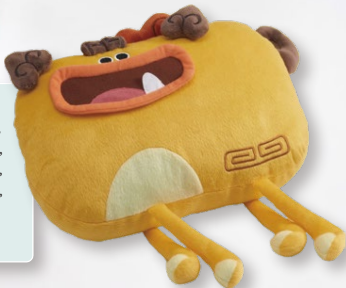
阿虎抱抱枕 NTD $ 480 約 20×30cm

為史博館形象 IP「酷獸奇航」授權產品之一，從史博館國寶與重要古物中衍生出的文創商品，其原型為國寶《獸形器座》的酷獸娃娃絨毛玩具，以及原型為《虎形尊》的阿虎抱抱枕絨毛娃娃，深獲史博館粉絲青睞。