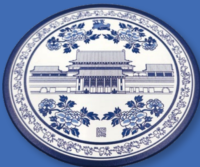
酷獸青花 吸水杯墊