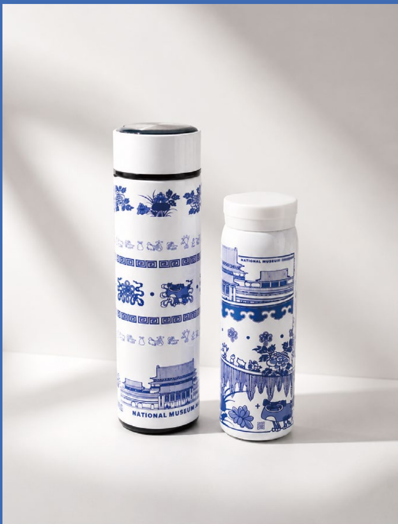
酷獸青花保溫瓶 500 ml