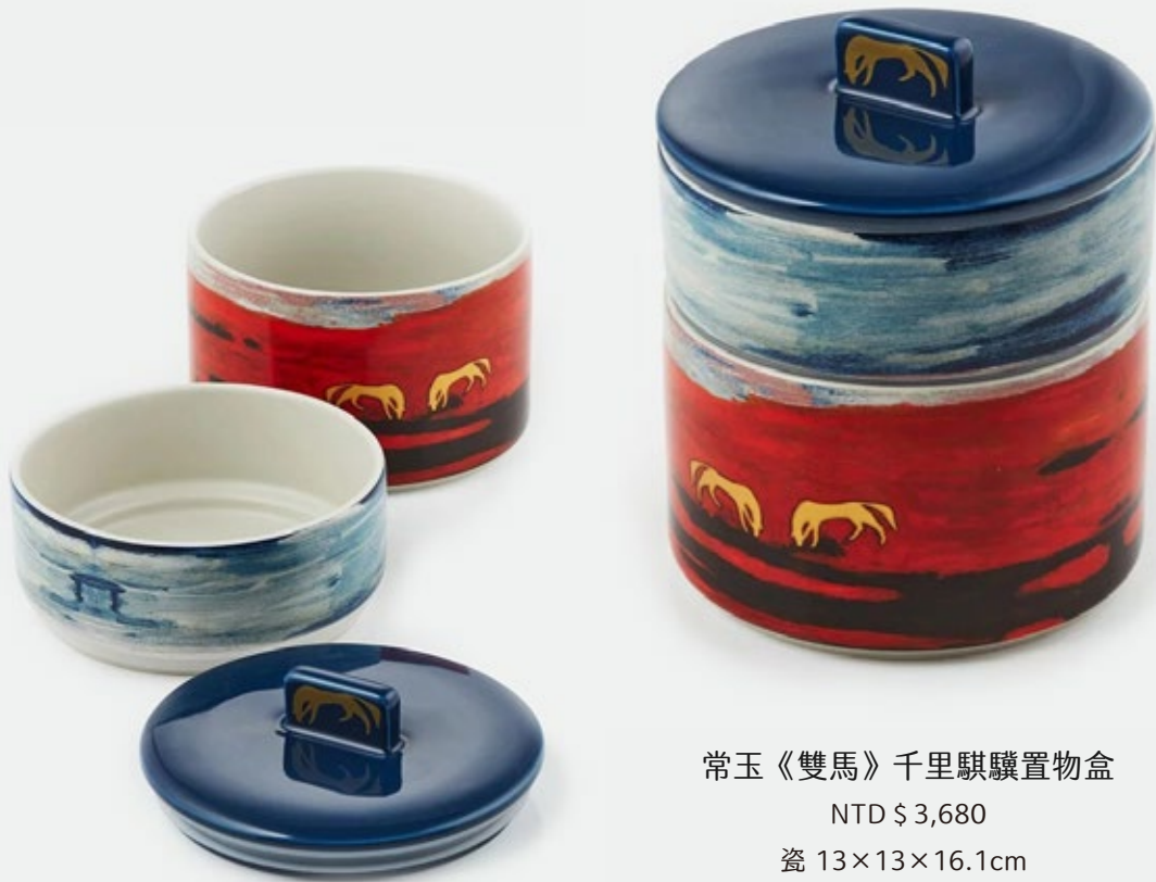
常玉《雙馬》千里騏驎置物盒