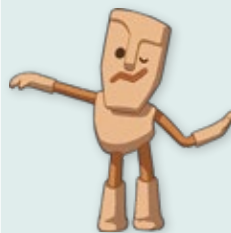
樂樂 Clayton 總登錄號 IP010-2