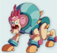
猛哥 The Tomb-Guardian 總登錄號 IP008-2