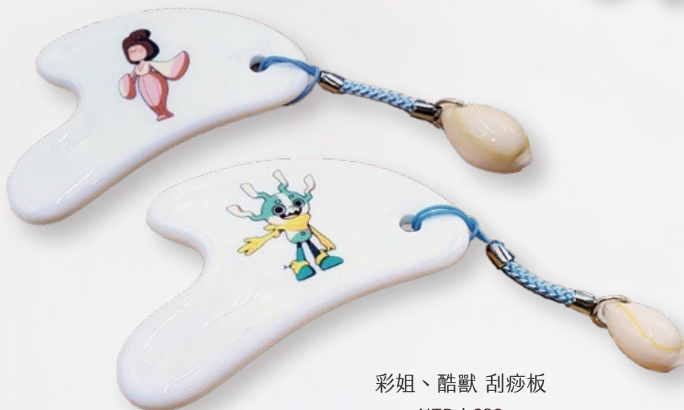
彩姐、酷獸 刮痧板 NTD $ 680 瓷 5.8×7.8×0.8cm

為史博館形象 IP「酷獸奇航」授權產品之一，從史博館國寶與重要古物中衍生出的文創商品，其原型為國寶《獸形器座》的酷獸娃娃絨毛玩具，以及原型為《虎形尊》的阿虎抱抱枕絨毛娃娃，深獲史博館粉絲青睞。