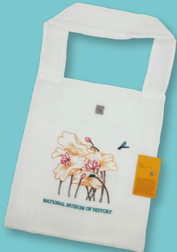
霧透網紗刺繡提袋-常玉荷花