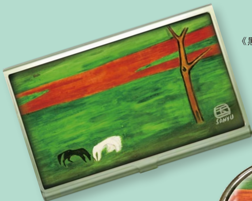
《黑白雙馬》防水油畫布名片盒