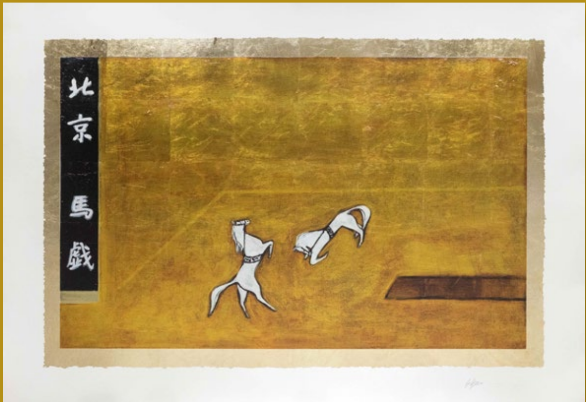
常玉《北京馬戲》館藏編號 26902 版畫尺寸：92.5×134cm 畫芯尺寸：69.5×111cm