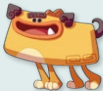
阿虎 Tigrio 總登錄號 IP003-2