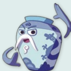
青龍 Ferrell 總登錄號 IP011-2