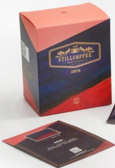
常玉STILL精品咖啡 26878 斑馬 (紅色款) NTD $ 220 / 盒

濾掛式咖啡包 5入 淨重10公克/包 產地 中南美洲 烘焙程度 中焙 處理方式 水洗處理法+蜜處理法 濃郁甘醇、滑順香濃飽滿、甜度明顯。