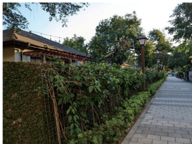
圖九 由七里香形成的綠圍籬