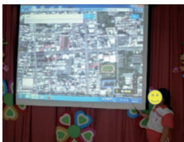
圖二 學生在 Google Earth 指認眷村位置

接著，研究者在第 2 節課中透過影片介紹眷村的傳統美食製作方法，並在教室準備了蔥油餅、甜燒餅、韭菜盒、包子、饅頭等食物成品，讓學生品嚐，並鼓勵學生分享感想，如圖三。