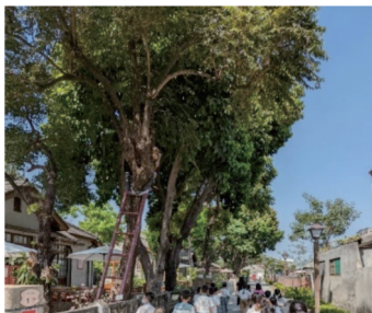
圖八 參天百年大樹