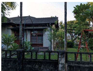
圖四 眷舍為日式建築物

完成明信片後，承租者導讀「勝利貓日子」的繪本，藉由繪本中愛在眷村中四處走動的主角花花，帶領學生進入眷村時光，能夠認識淺顯的眷村文化。