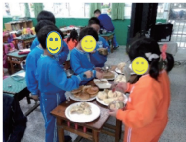
圖三 學生品嚐美食