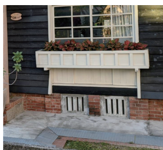
圖五 房舍底下欄杆式的氣孔