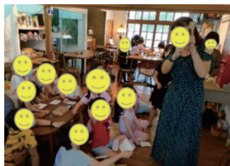
圖十一 學生聽講書寫明信片