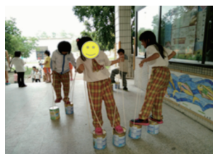
圖十二 踩鐵罐的體驗

在各地眷村中，皆有本地子弟組成的民間社團，致力於眷村文化的保存。學校考慮學生能力，因此規劃在中、高年級也結合民間社團人士入班帶領學生進行眷村繪畫、地圖創作或是結合美術、作文的眷村文化，由任課老師結合社區人士，以小組方式進行製作完成教學成果。