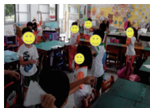
圖十三 紙炮的體驗