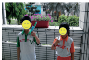
圖十四 Y型紙降落傘的體驗