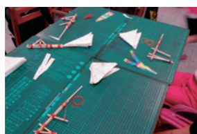
圖十五 竹槍的體驗