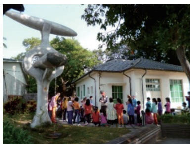
圖六 飛機副油箱改裝成水塔